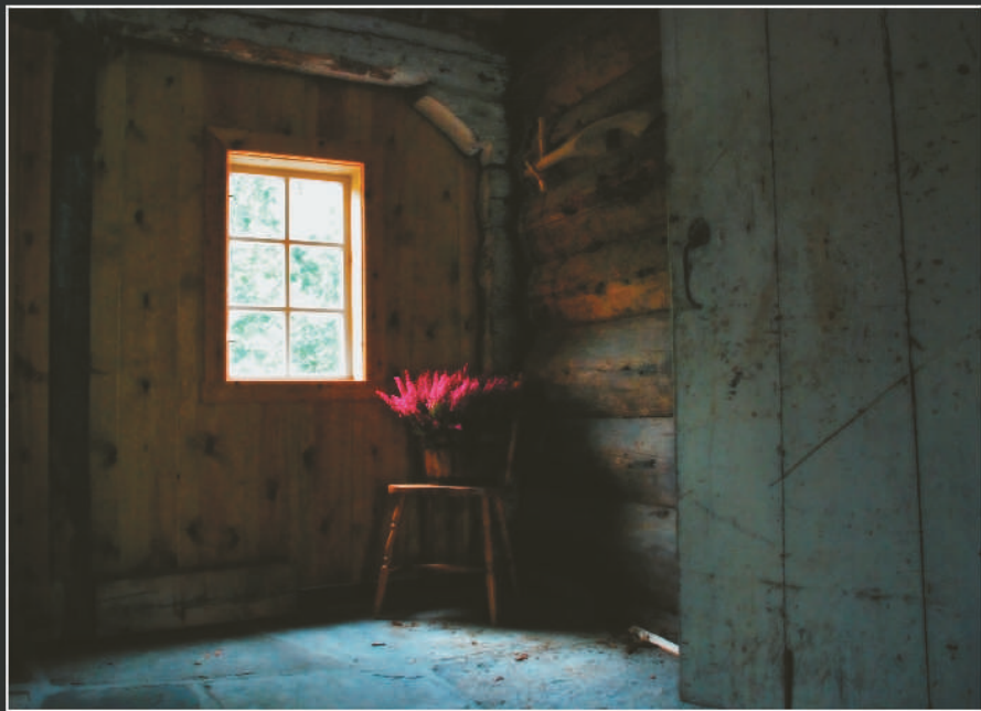
Kulturminnet Malmanger Gard The Malmanger vicarage; a cultural heritage